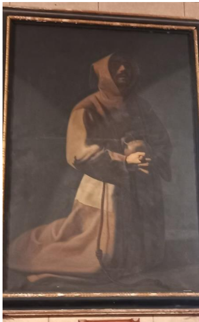
« La vision de St Benoît » 1849 Huile sur toile de Clémence Dimie d'après Eustache Le Sueur (1654-55) L'original est conservé musée du Louvre

A l'initiative de l'association « Entretien et Sauver la Crèche de Lachassagne », et en lien avec la Mairie, propriétaire des lieux, des démarches ont été faites pour envisager la restauration de deux tableaux accrochés dans les allées latérales de l'église.